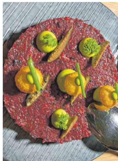
Auch das Auge isst im vegetarischen Restaurant Tian mit, etwa beim Rote-Beete-Carpaccio.