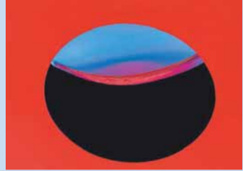
Im Skyspace.

Seit 2018 gibt es auf dem Tannegg-Gelände in Oberlech ein unterirdisches Skyspace von James Turell. Bei Einbruch der Dämmerung – kurz vor dem Sonnenaufgang und dem Sonnenuntergang – werden dort Wände und Decke in farblich wechselndes Licht getaucht. Die geöffnete Kuppel verengt das Blickfeld des Himmels so, dass ein völlig neues Gefühl von Raum und Zeit entsteht. Die Installation ist jederzeit zugänglich.