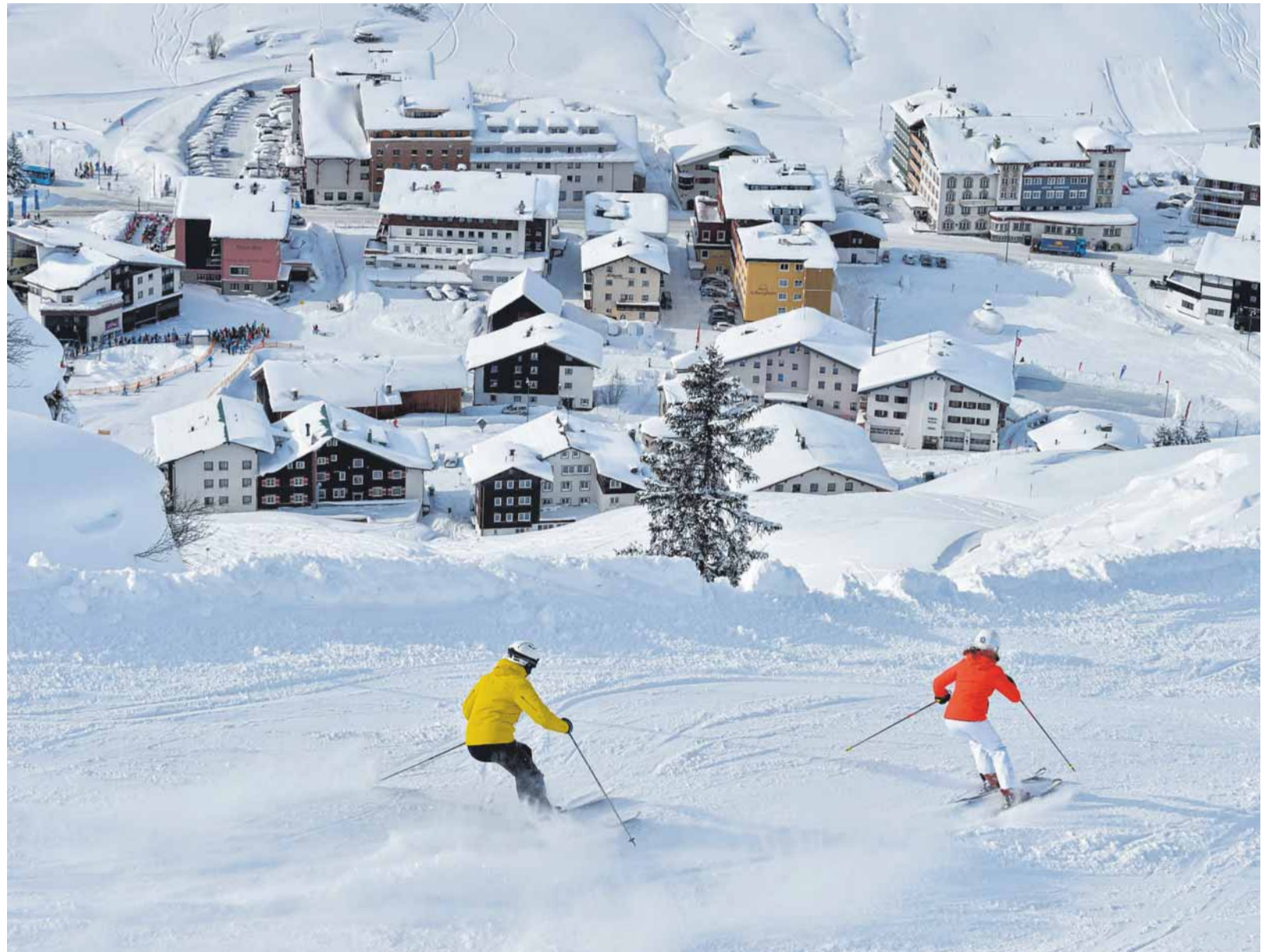
Der Arlberg ist extrem abwechslungsreich und schneesicher. So können die Wintersportler immer bis ins Tal hinabfahren, wie hier nach Lech.