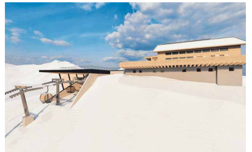
Die neue Zugerbergbahn.